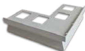
BHOE - A22