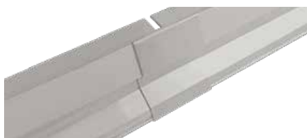
BHOG - A22